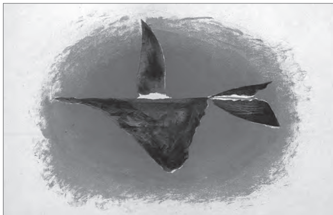
G. Braque, Au couchant (Oiseau XVI), 1958

Vieni, santo Spirito, mandaci dal cielo un raggio della tua luce. Vieni, Padre dei poveri, vieni, luce dei cuori. Nella fatica sei pace, nella calura sollievo, nel pianto conforto. Luce infinitamente beata, riempi l'intimo dei cuori di coloro che a te si affidano.