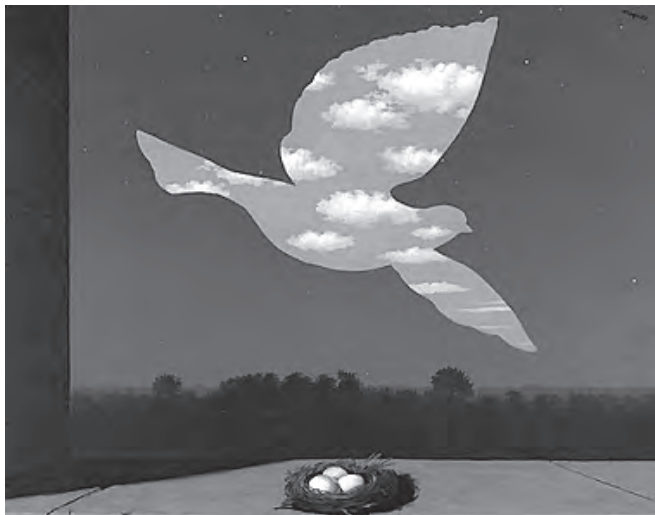
René Magritte, Il ritorno

Lo Spirito non ha frontiere. Egli è presente nella bellezza del mondo e nel tessuto della storia.